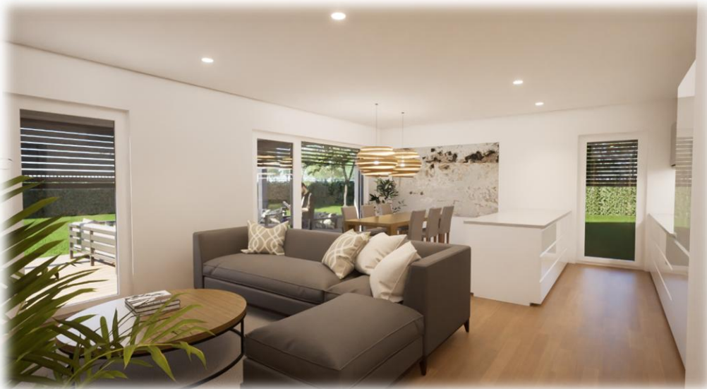
Simbolične slike objekta