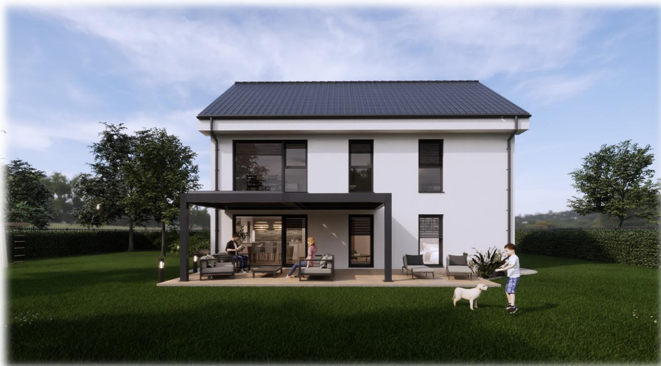
Simbolične slike objekta