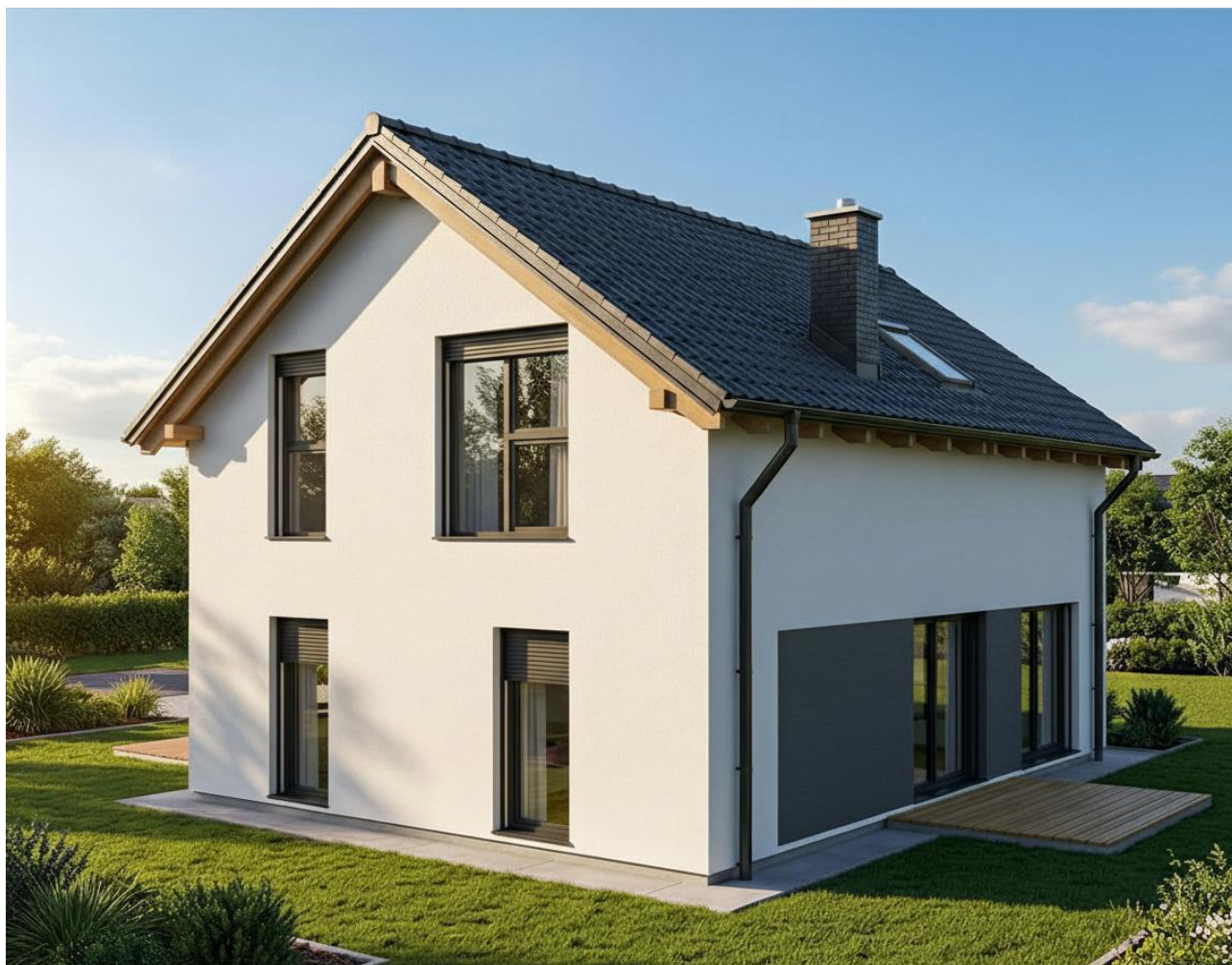
Simbolične slike objekta