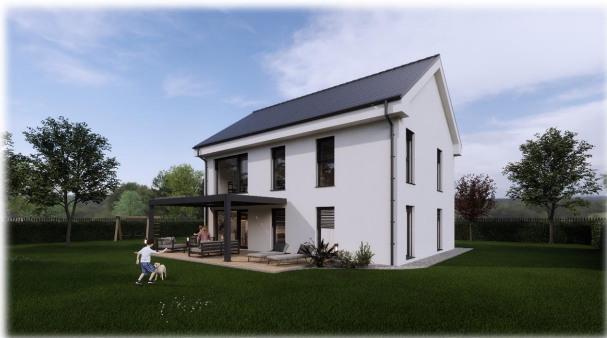
Simbolične slike objekta