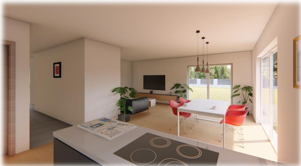
Simbolične slike objekta