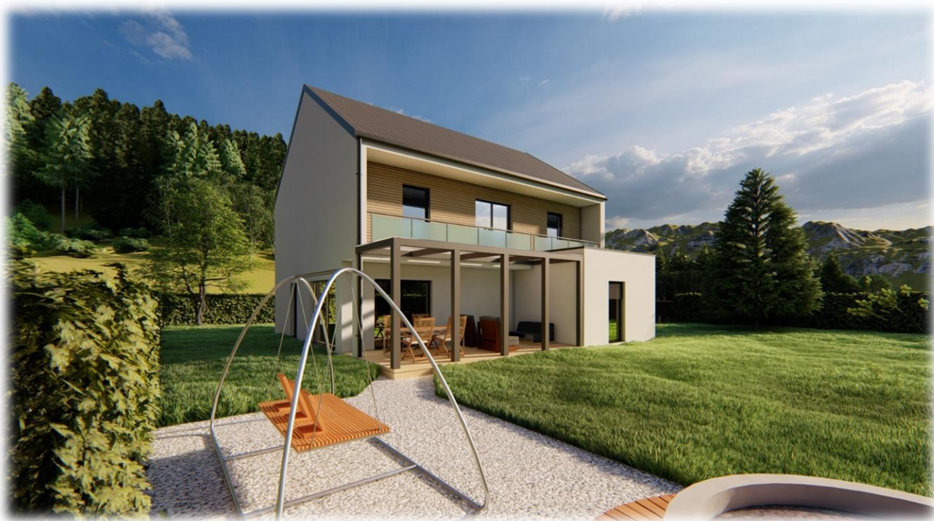
Simbolične slike objekta