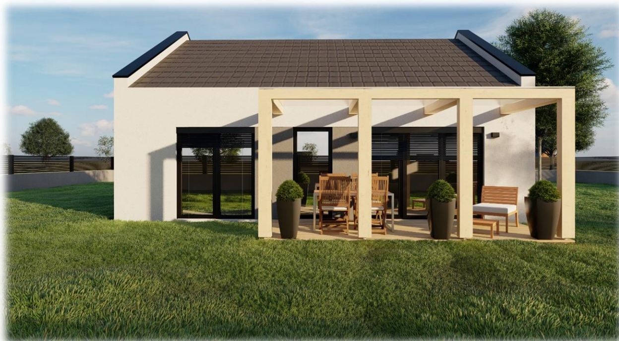
Simbolične slike objekta