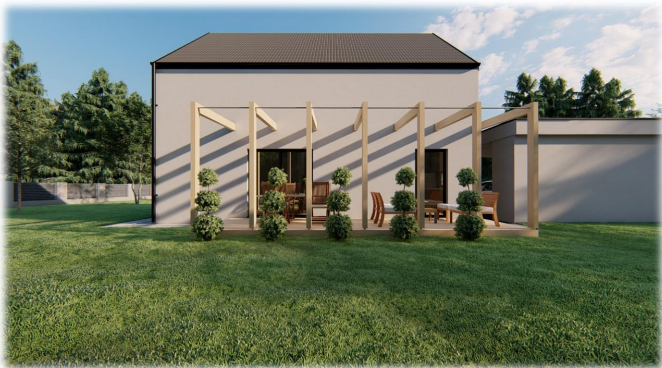
Simbolične slike objekta